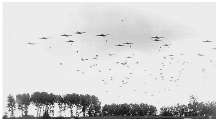
Luftbårent infanteri fra 82. Airborne Division, "All Americans" springer ud nær Grave den 17. september 1944.